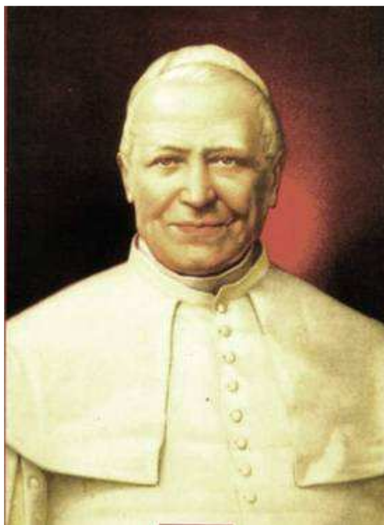
San Pio IX