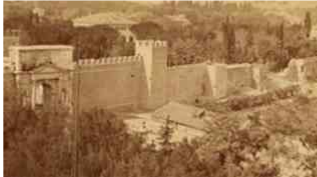
Sulla sinistra Porta Pia ben visibile dietro gli alberi, sulla destra, a qualche centinaio di metri, la “breccia” tanto inutile quanto grottesca