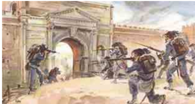
I bersaglieri “tirano” ad una porta aperta e senza difesa