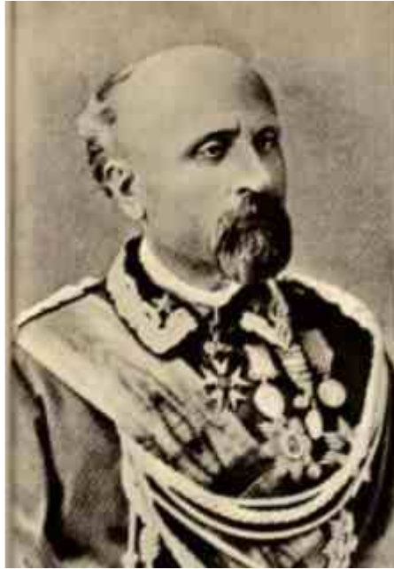
Il Generale Raffaele Cadorna Comandante delle Truppe piratesche di assalto