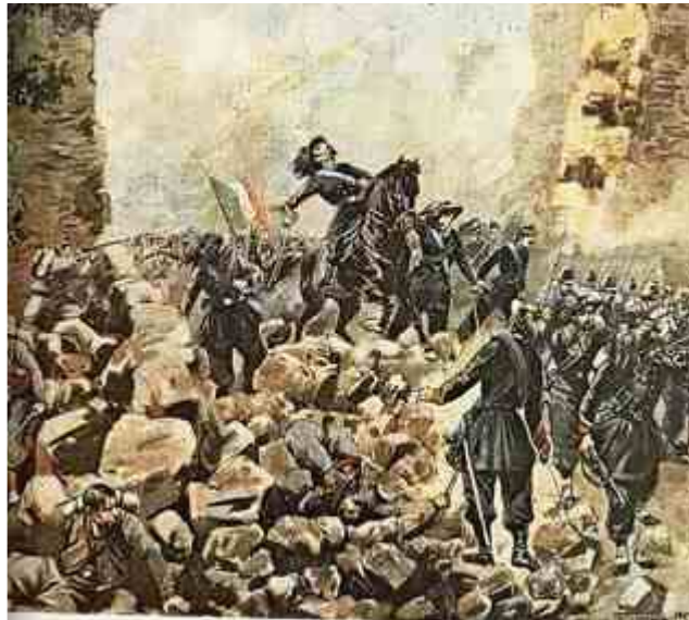
La retorica risorgimentale “uccide” un ufficiale sabaudo, in verità colpito dal fuoco amico