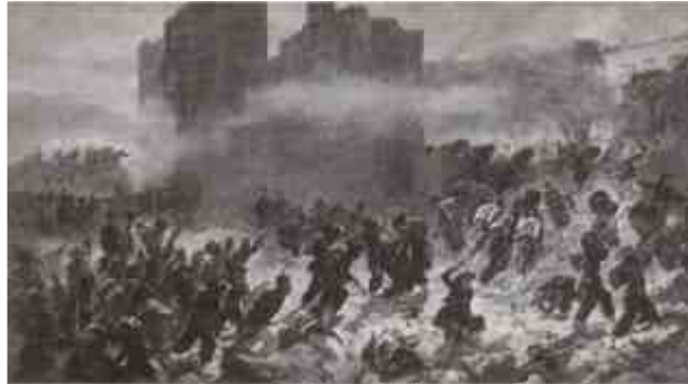
La grottesca carica di un possente esercito senza nemici