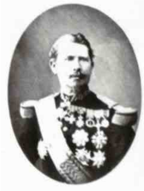
Il Generale Hermann Kanzler Comandante delle Truppe del Papa