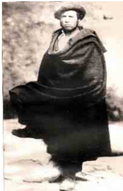
Petrelli il Brigante “ metà Lupo e metà Volpe ”