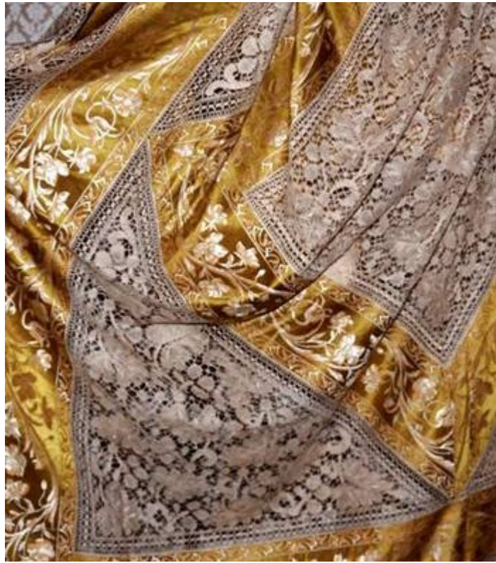
San Leucio "Il Manto della Regina"