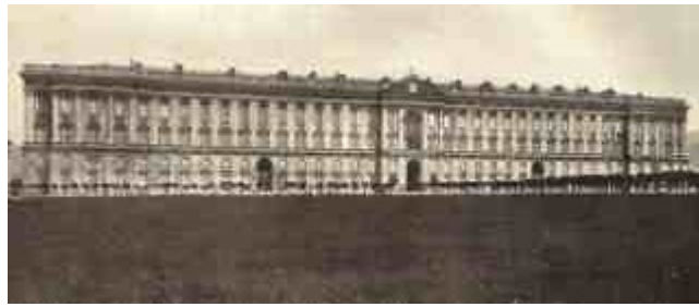
La Reggia di Caserta in una inedita foto del 1860