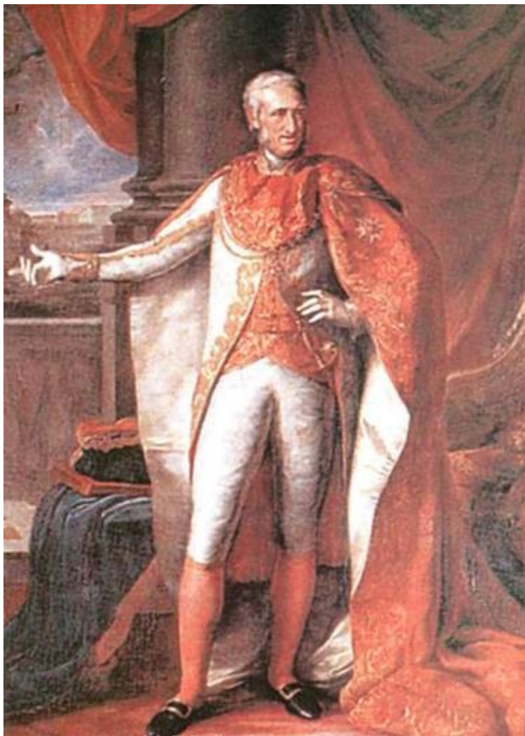
S.M. Re Ferdinando IV di Borbone