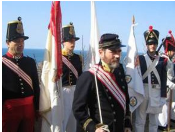
Alcuni dei militari che "monteranno di guardia" alla Reggia