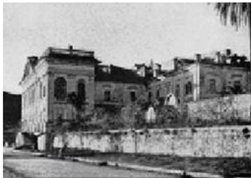
Il Belvedere di San Leucio In una foto del 1900