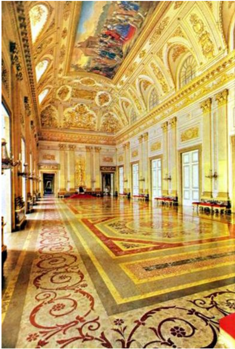
Reggia di Caserta La Sala dove si terrà il “Gran Ballo”